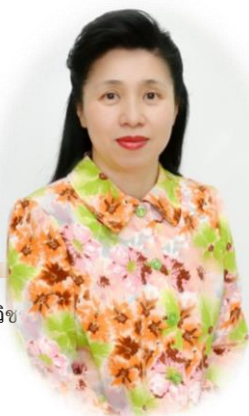
ภาควิชา คณะครุศาสตร์ จุฬาลงกรณ์มหาวิทยาลัย