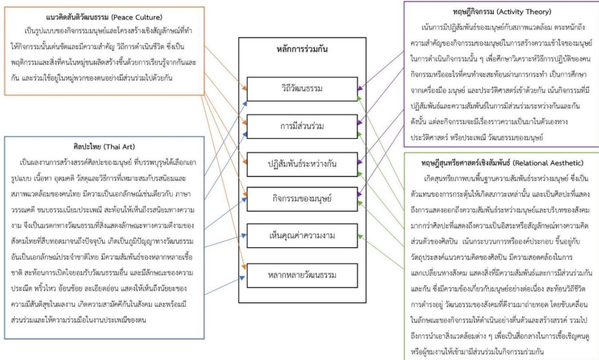
ภาพที่ 1 การสังเคราะห์หลักการร่วมกันของการเกิดสันติวัฒนธรรมจากแนวคิดสันติวัฒนธรรม ร่วมกับทฤษฎีกิจกรรม ทฤษฎีสุนทรียศาสตร์เชิงสัมพันธ์ และศิลปะไทยเพื่อนำเสนอกระบวนการจัดกิจกรรมแบบร่วมสมัย

จากแผนภาพข้างต้น สามารถสรุปหลักการร่วมกันได้ ดังนี้