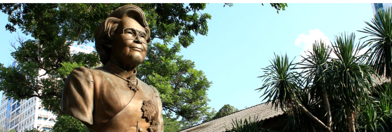
แผน ก (1.1) 60 หน่วยกิต

สำเร็จปริญญาโท สาขาวิชาดนตรีศึกษา จากสถาบันที่กระทรวง ศึกษาธิการ หรือ กระทรวงการอุดมศึกษา วิทยาศาสตร์ วิจัยและ นวัตกรรม หรือกระทรวงวัฒนธรรมรับรอง โดยมีแต้มเฉลี่ยสะสมไม่ต่ำ กว่า 3.50 จากระบบ 4 แต้ม หรือผู้สำเร็จปริญญาโท สาขาวิชา อื่น ๆ ที่มีประสบการณ์สอน หรือการบริหาร หรือการวิจัยที่เกี่ยวข้องกับ ดนตรีมากกว่า 5 ปี หรือ มีผลงานอื่นที่เทียบเท่า