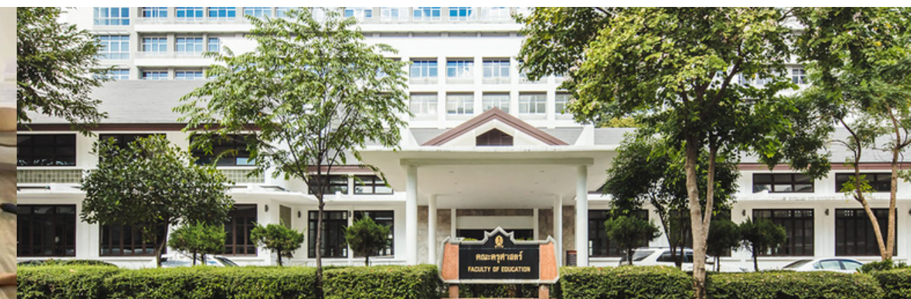
แผน ค (2.2) 84 หน่วยกิต

สำเร็จปริญญาโท สาขาวิชาดนตรีศึกษา หรือ ปริญญาโท บัณฑิตสาขาอื่นๆ ที่มีประสบการณ์สอนหรือการบริหารไม่น้อยกว่า 2 ปี จากสถาบันอุดมศึกษาที่กระทรวงศึกษาธิการ หรือกระทรวงการ อุดมศึกษา วิทยาศาสตร์ วิจัยและนวัตกรรม หรือกระทรวงวัฒนธรรม รับรอง