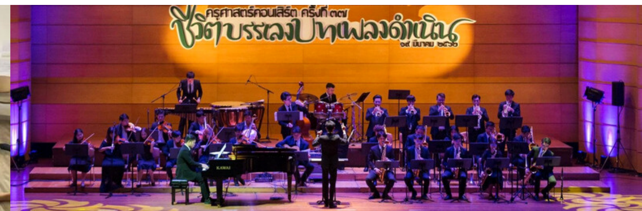
วิชาเอก การสอนดนตรีสากล

วิชาเอก 65 หน่วยกิต ประกอบด้วย รายวิชาบังคับ 44-45 หน่วยกิต - รายวิชาบังคับร่วม 19 หน่วยกิต - รายวิชาบังคับเฉพาะ 25-26 หน่วยกิต (ดนตรีไทย 25 ดนตรีสากล 26 หน่วยกิต) รายวิชาเลือก 20-21 หน่วยกิต