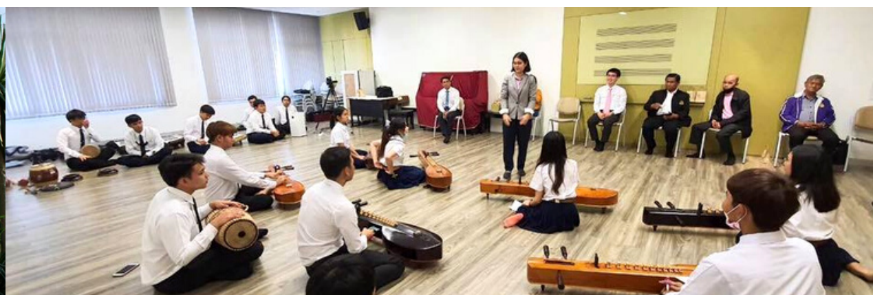
แผน ก 2 36 หน่วยกิต

ผู้เข้าศึกษาต้องมีวุฒิปริญญาตรีทางการศึกษาและการทำวิจัย และต้องทำการเรียนวิชาการศึกษาเพื่อการพัฒนาที่ยั่งยืน และศาสตรวิชาครู เป็นรายวิชาพื้นฐาน (สำหรับผู้ที่เรียนวิชานี้แล้วในระดับปริญญาบัณฑิตไม่ต้องเรียนซ้ำอีก) และต้องลงเรียนรายวิชาสัมมนาวิจัยทุกภาคการศึกษาโดยประเมินผลเป็น S/U และไม่นับหน่วยกิตในหลักสูตร